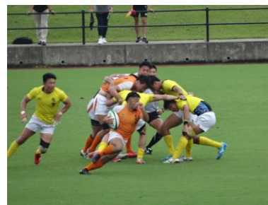
国民体育大会ブロック大会 ラグビーフットボール競技の様子