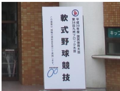
国民体育大会ブロック大会 競技会場の表示

全国9ブロックで実施した国民体育大会ブロック大会に対し、開催費の一部を助成した(参加者42,560名)。