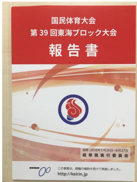
国民体育大会第39回東海ブロック大会報告書